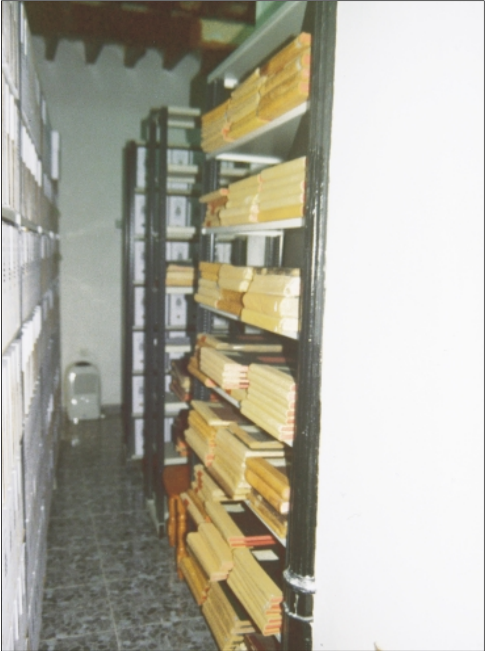
Instalaciones actuales 2001.