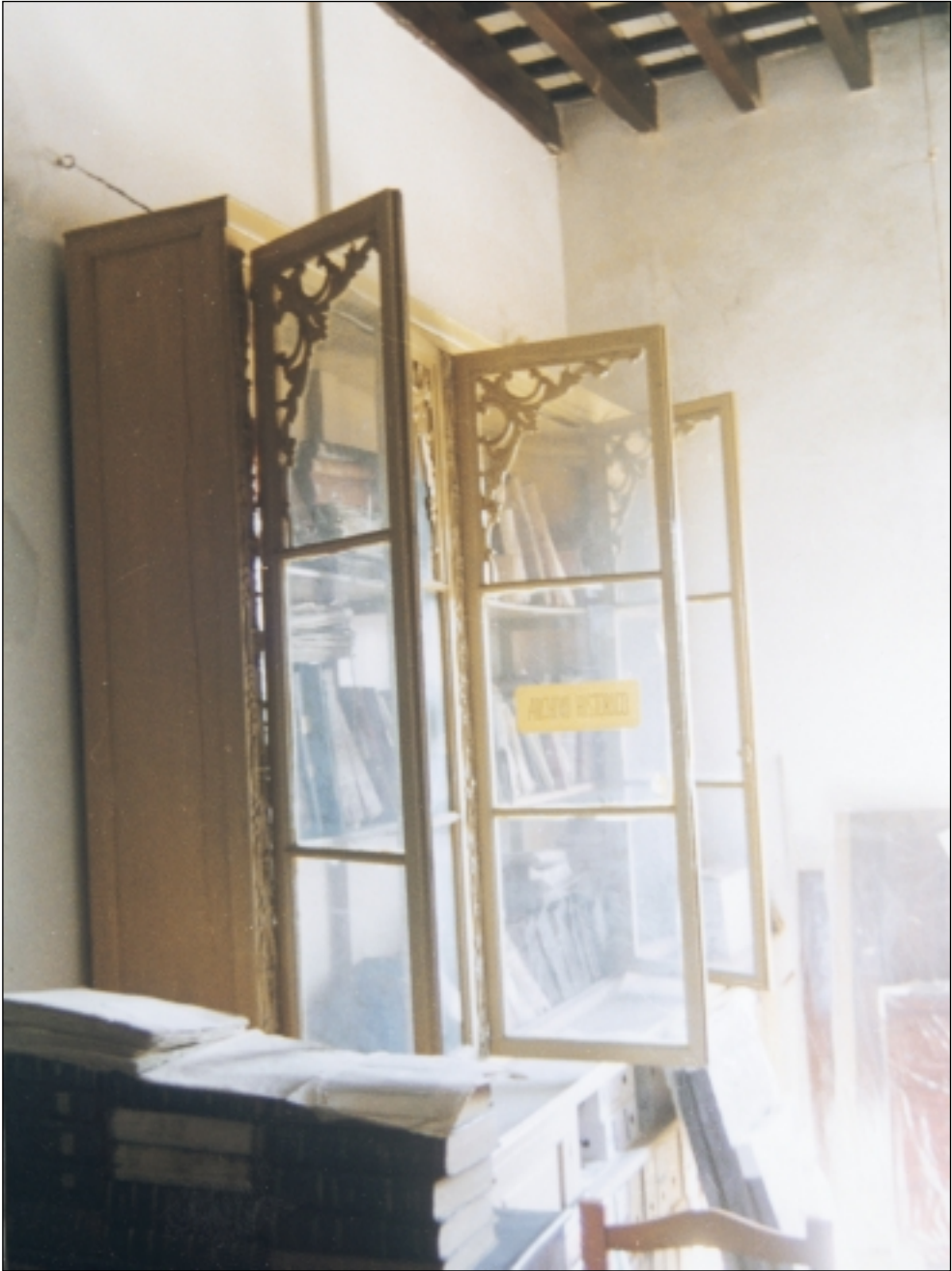
Mobiliario del Archivo 1998.