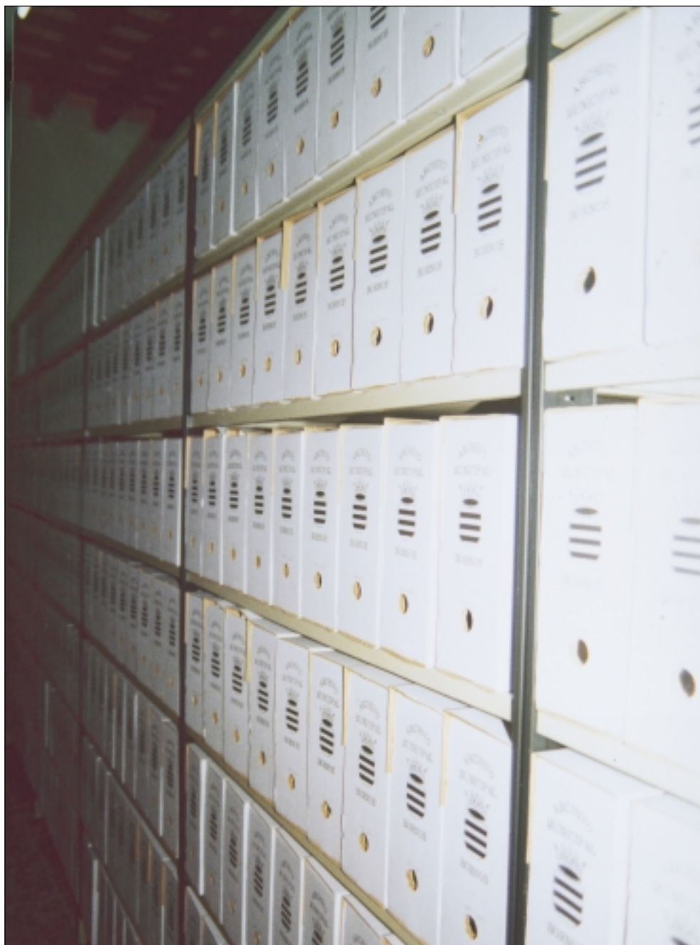
Detalle de estanterías y cajas 2001.