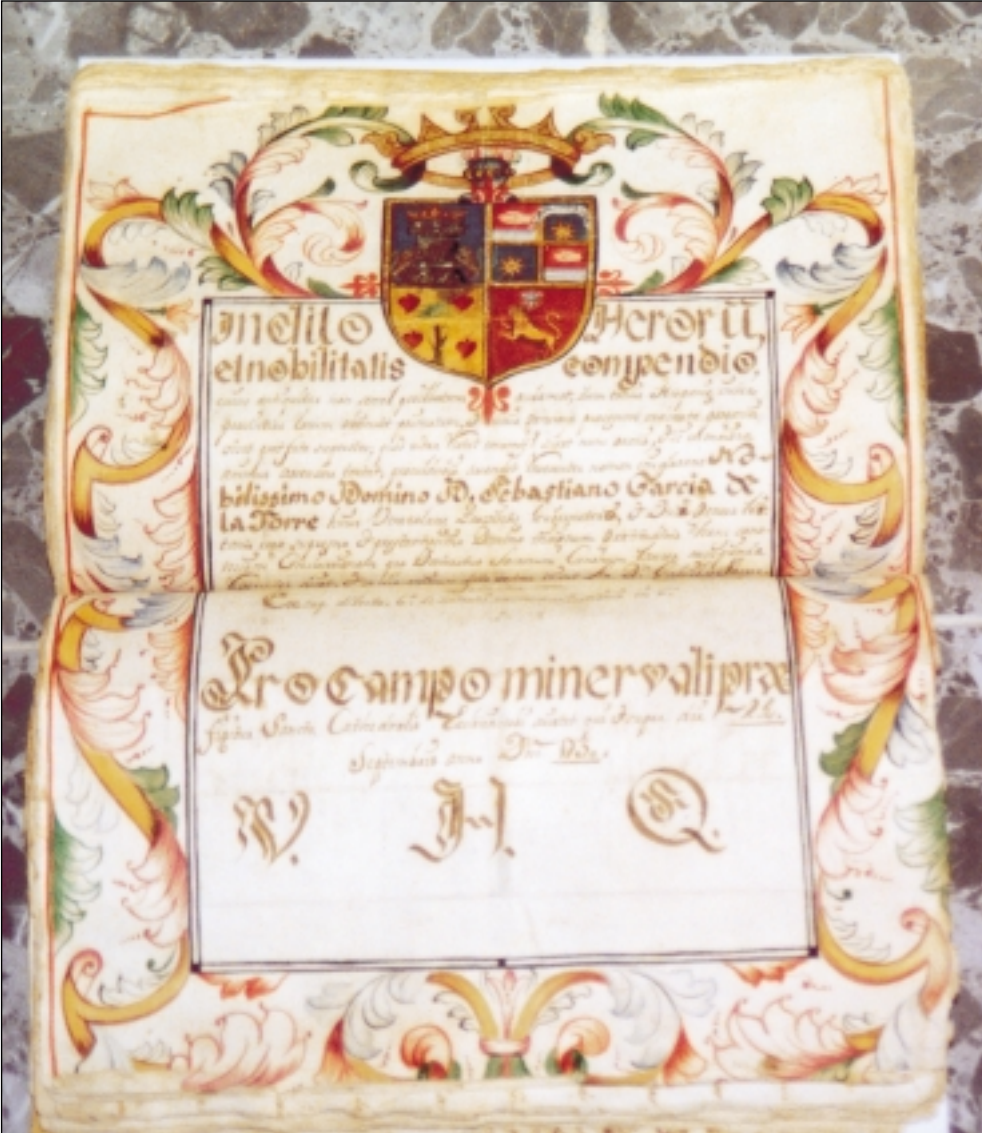
Expediente de Limpieza de Sangre, 1754.