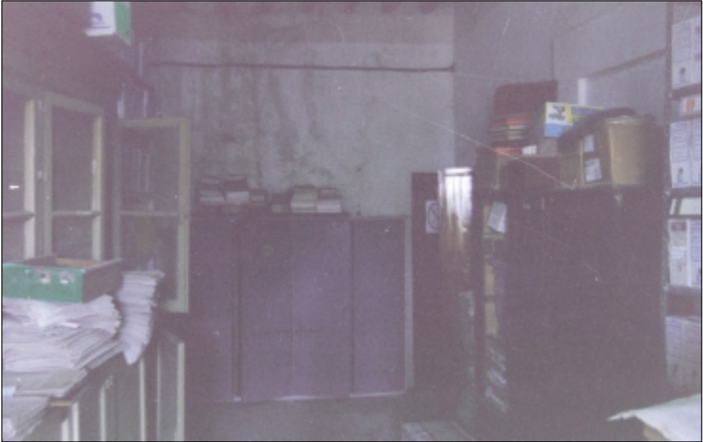
Estado del Archivo antes de su organización 1998.