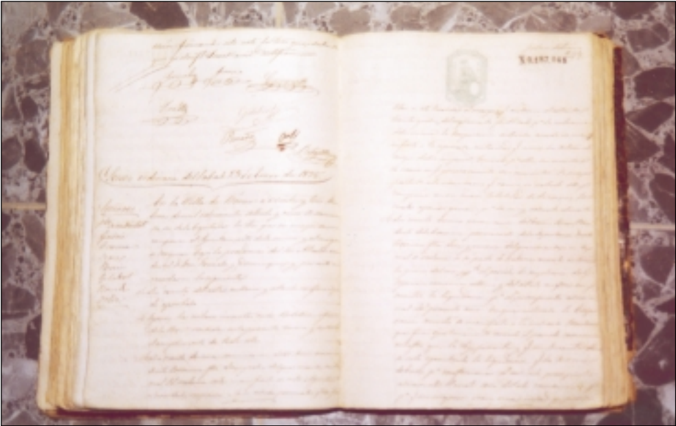
Libro de Actas de Sesiones de Ayuntamiento Pleno 1872.