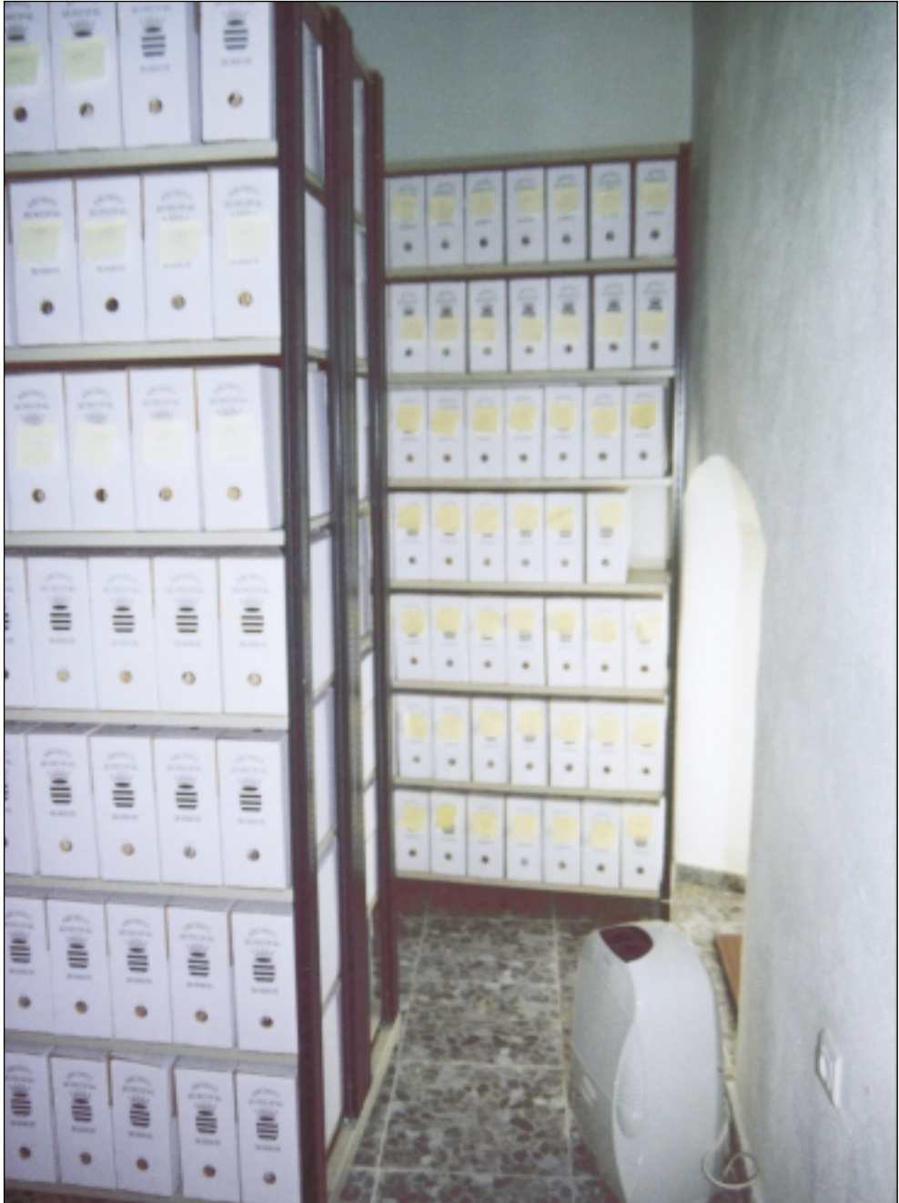
Sistema de control de humedad 2001.