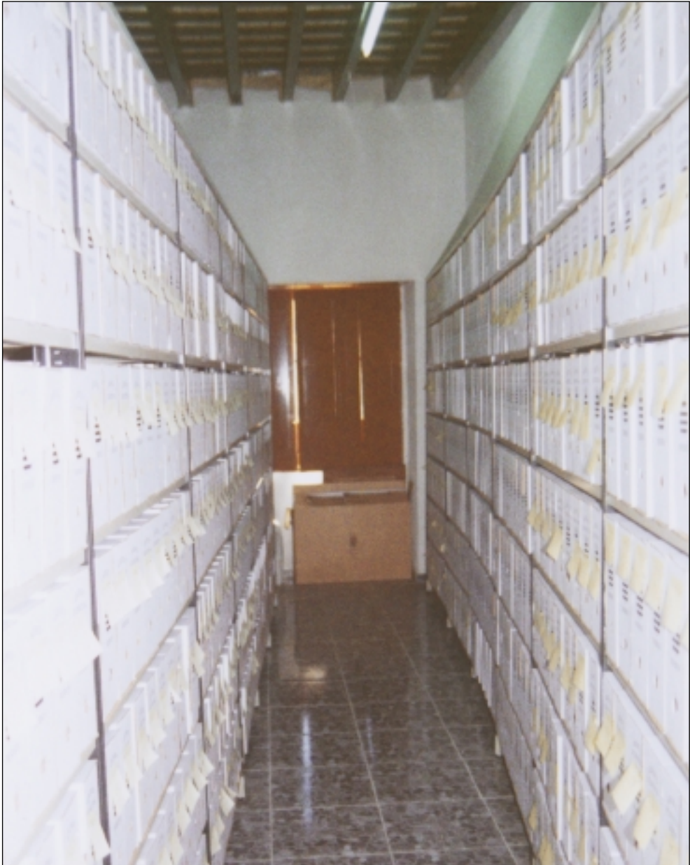
Vista de un pasillo del Archivo 2001.