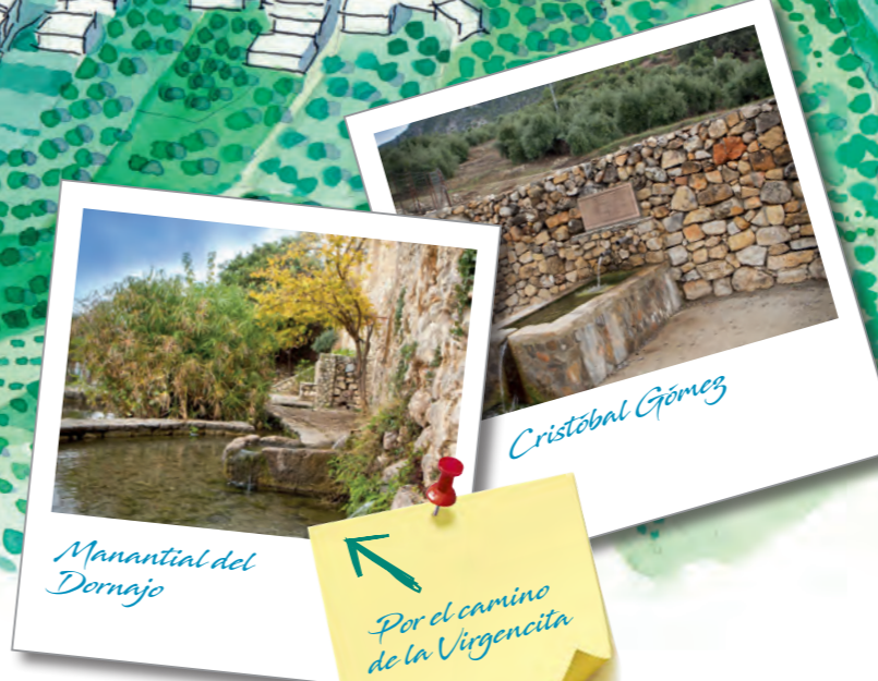
Manantial del Dornajo

El manantial nace bajo el muro de mampostería construido en piedra junto a unas casas. El agua es distribuida a un chorro de agua que cae a un pequeño pilar para consumo humano y a un estanque semicircular de poca altura dividido en dos partes. Podemos observar dentro de los pilares flora acuática como el papiro.