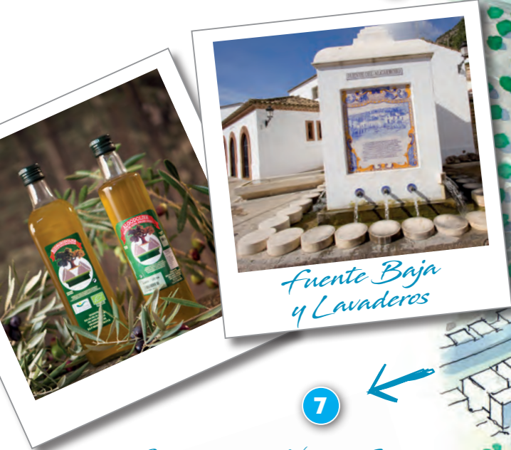
Fuente Baja y Lavaderos

Recorrido: Desde la Plaza en Avda. Constitución, donde se encuentra la Iglesia de Santa Ana, nos encaminamos hacia el Molino Lebrón; después pasando por la callejuela El Sesmo nos dirigimos a la Fuente Baja y conectamos con la Cooperativa Ntra. Sra. Del Rosario y desde ahí a la Fuente de Cristóbal Gómez. Ya de vuelta pasamos por el Manantial del Dornajo hacia la Ermita de la Virgencita, la calle Sierrecilla, la Fuente Alta y terminamos en la Plaza de la Avda. Constitución.