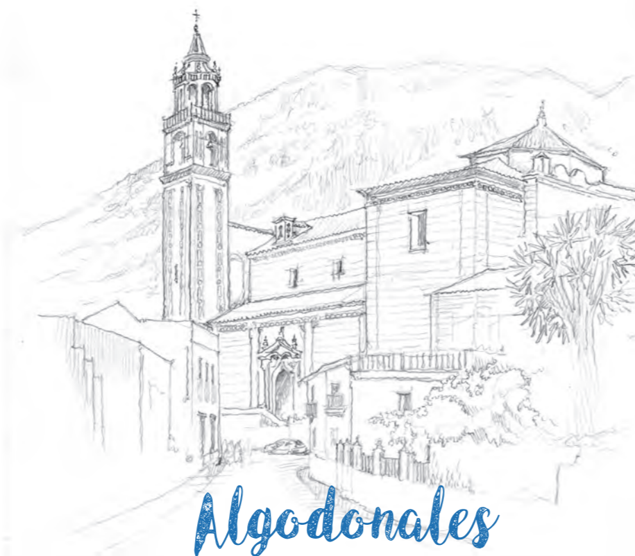
Sierra de Lijar